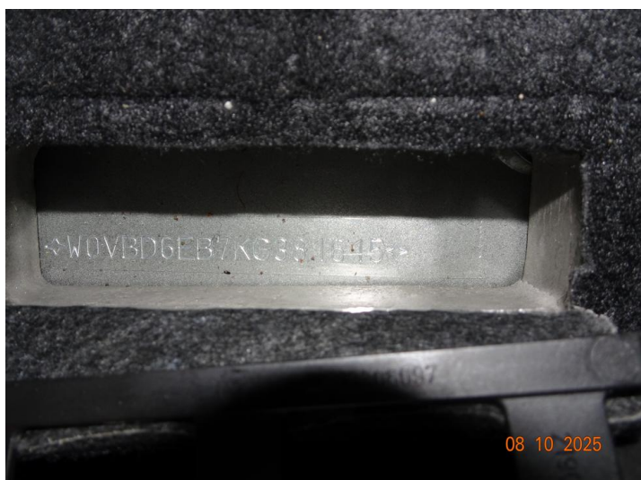
Pole numerowe z numerem nadwozia VIN