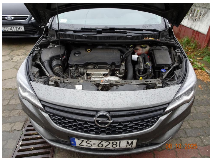
Widok komory silnika