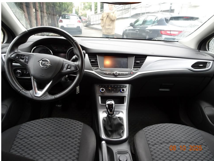
Widok wn trza samochodu