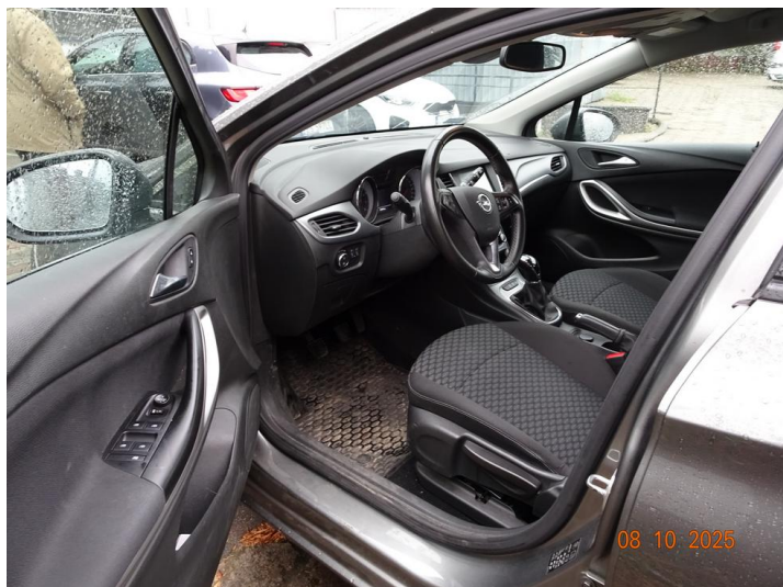
Widok wn trza samochodu